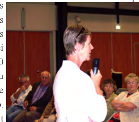
Réunion à Etréchy le 5 juin 2009