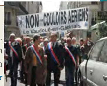
Manifestation contre le couloir aérien à Paris le 14 mai 2011

J'interviens régulièrement sur les problématiques et dossiers relatifs aux couloirs aériens dans l'Essonne. La DGAC a la volonté de relever l'altitude d'arrivée des avions en provenance du Sud-Est à destination de l'aéroport d'Orly et en configuration de vent d'est. Pourtant, cette modification du couloir aérien sous prétexte de réduire les nuisances sonores pour les populations survolées, ne ferait que déplacer les nuisances vers d'autres populations . En outre, les temps de vol étant allongés, il serait en totale contradiction avec les objectifs du Grenelle de l'environnement . Avec les Parcs Naturels du Gâtinais Français et de la Haute Vallée de Chevreuse, nous avons proposé des solutions permettant une réduction des nuisances et de l'émission de gaz à effet de serre. Ma mobilisation et celles d'autres élus et associations a (pour l'instant) permis de retarder le projet jusqu'à septembre 2011. Elle reste constante.