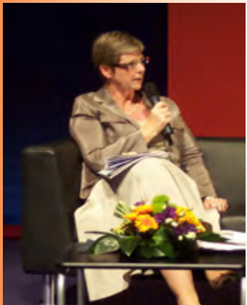
Conférence-débat «l'Essonne au cœur du Grand Paris » le 4 juin 2009

« Pour que les projets portés par les collectivités puissent voir le jour, j'ai été signataire de la proposition de loi socialiste visant à faciliter la mise en chantier des projets des collectivités locales d'Ile-de-France, adoptée à l'unanimité. »