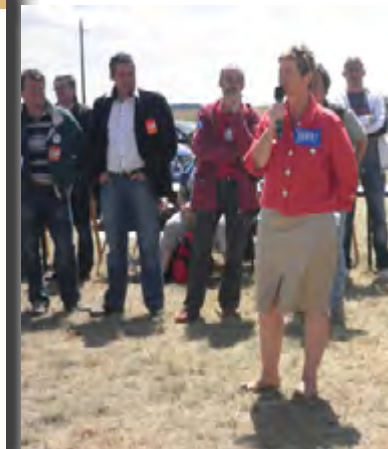
Le 12 mai 2011 à l'hôpital de Champcueil suite aux menaces de fermeture de lits

« Le scénario que nous entrevoyons est prévisible : acte I, on organise les carences du service public ; acte II, on conclut à son absence de fiabilité ; acte III, on réoriente les décisions et les financements vers le privé. Le tour est joué ! Parmi d'autres exemples criants sur le territoire national, je retiendrai celui de l'hôpital de Juvisy-sur-Orge, où le conseil d'administration avait décidé de fermer les services de chirurgie et de maternité sans aucune justification – financière, sanitaire, sécuritaire ou démographique – valable. Cette décision met évidemment en difficulté le service des urgences, qui sert un bassin de plus de 200 000 habitants et qui est contraint de fonctionner en étant amputé de son plateau technique de chirurgie. » (Extrait de mon intervention le 13 mai 2009 lors des débats sur le projet de loi Hôpital, patients, santé et territoires)