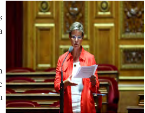
Le 6 octobre 2010 : question orale sur l'état d'avancement des dossiers d'indemnisation

Une fois encore l'Essonne a été touchée et les communes se battent aujourd'hui pour obtenir des réponses quant à leur classement en CAT-NAT. Je les soutiens dans leur combat.