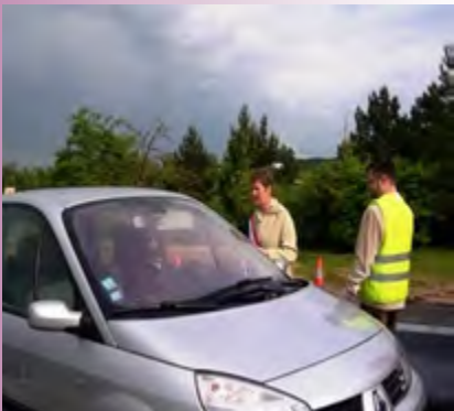
Manifestation au péage de Dourdan le 14 mai 2009